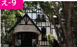
オーベルジュ・ドゥ ら・ルーナ http://www.la-luna.com/ TEL 0279-96-1155