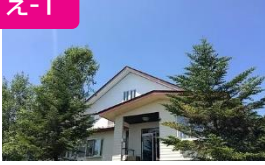
バラギ高原ロッジ http://baragi.co.jp/ TEL 0279-96-1488