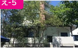
エポ http://www.p-epo.jp/ TEL 0279-96-1881