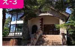
プチホテル マニトウ http://www.manitou.jp/ TEL 0279-96-1567