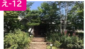
プチホテル白樺 http://www.ph-shirakaba.co.jp/ TEL 0279-96-1275