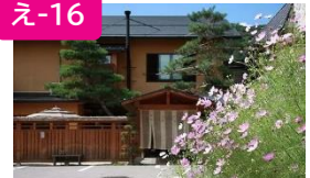
千川旅館別邸・花いち http://www.hoshikawa.jp/ TEL 0279-96-1511