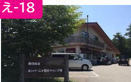
カンパーニャ嬭恋キャンプ場 https://www.muji.net/camp/tsumagoi/ TEL 03-5950-3660