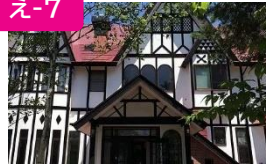
プチホテル アジル TEL 0279-96-1300