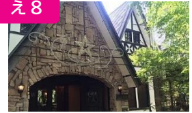
ラパン 別邸・森の月 http://www.rapan.net/ TEL 0279-96-1122