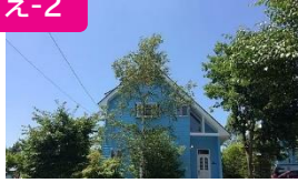
コテージ ら・ルーナ http://www.la-luna.co.jp/ TEL 0279-96-1800