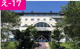
パルコール嬭恋リゾート https://tsumagoiskiresort.life/ TEL 0279-96-1166