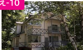
ミスティバラギ TEL 0279-97-3444