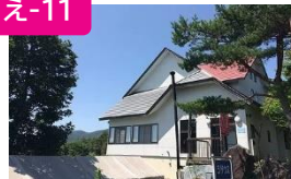
シャトレットシリウス TEL 0279-96-1091