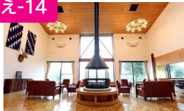
嬭恋の宿 あいさい http://yado-aisai.com/ TEL 0279-96-1280